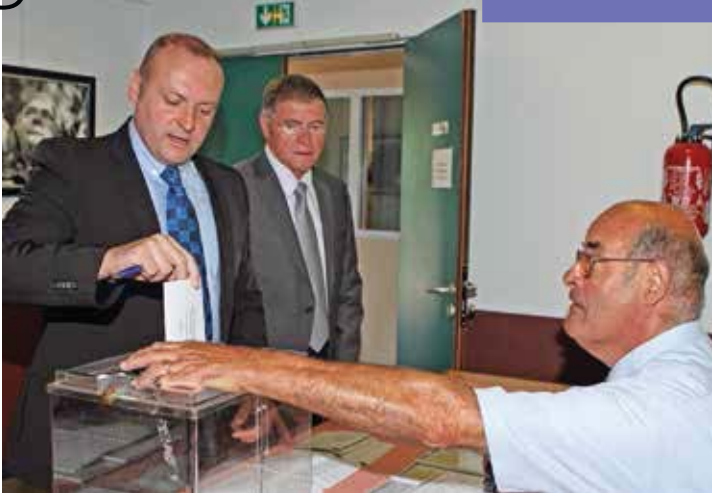
▲ Derniers votes avant l'Assemblée.