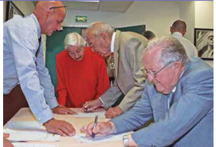
▲ Émargement des camarades présents.