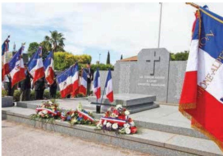
⤴ Le caveau des Gueules Cassées au cimetière de La Valette-du-Var.