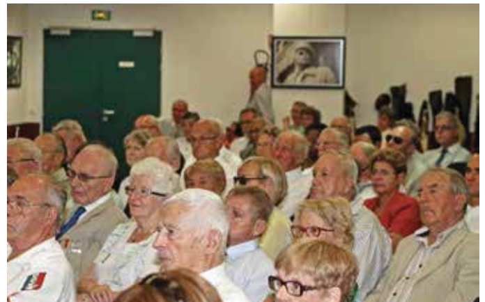
▲ Une assistance nombreuse participe à cette première Assemblée générale au domaine du Coudon.