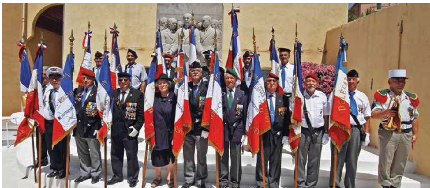
⚠ Nos porte-drapeaux, dévoués et toujours fidèles au poste.