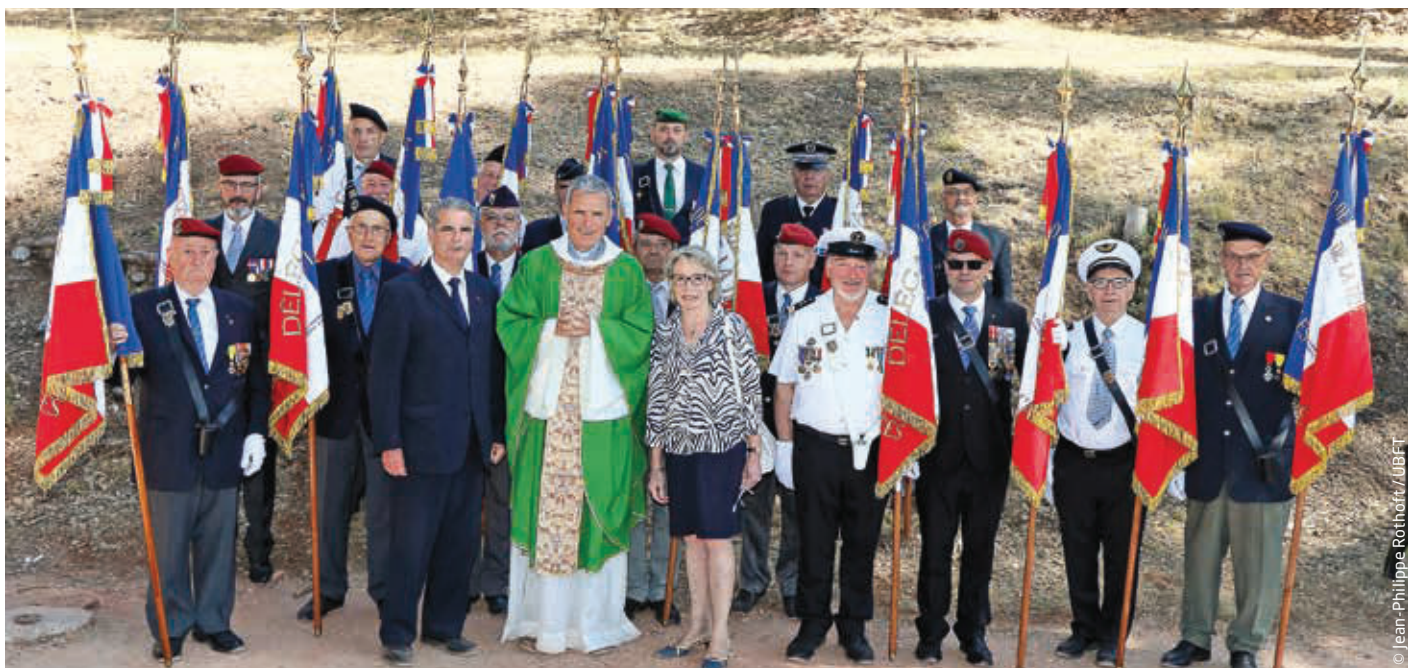
▲ La présence de nombreux camarades et amis.