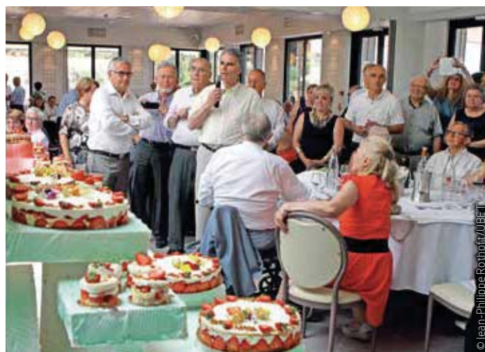
▲ Notre président a remercié, au nom de toutes les personnes présentes, toute l'équipe qui a contribué à la réussite de ce repas.