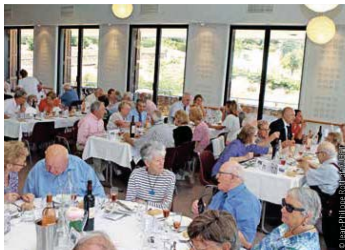
▲ Un repas regroupant tous nos camarades et amis.