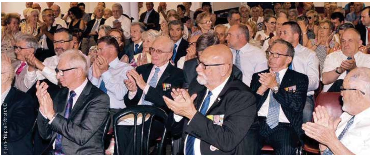
▲ Applaudissements pour les différents intervenants.