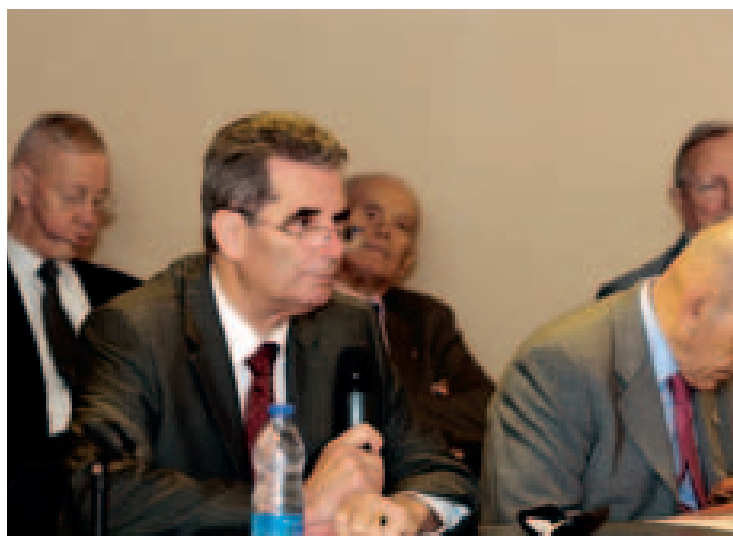
◀ Lecture du rapport moral du président.