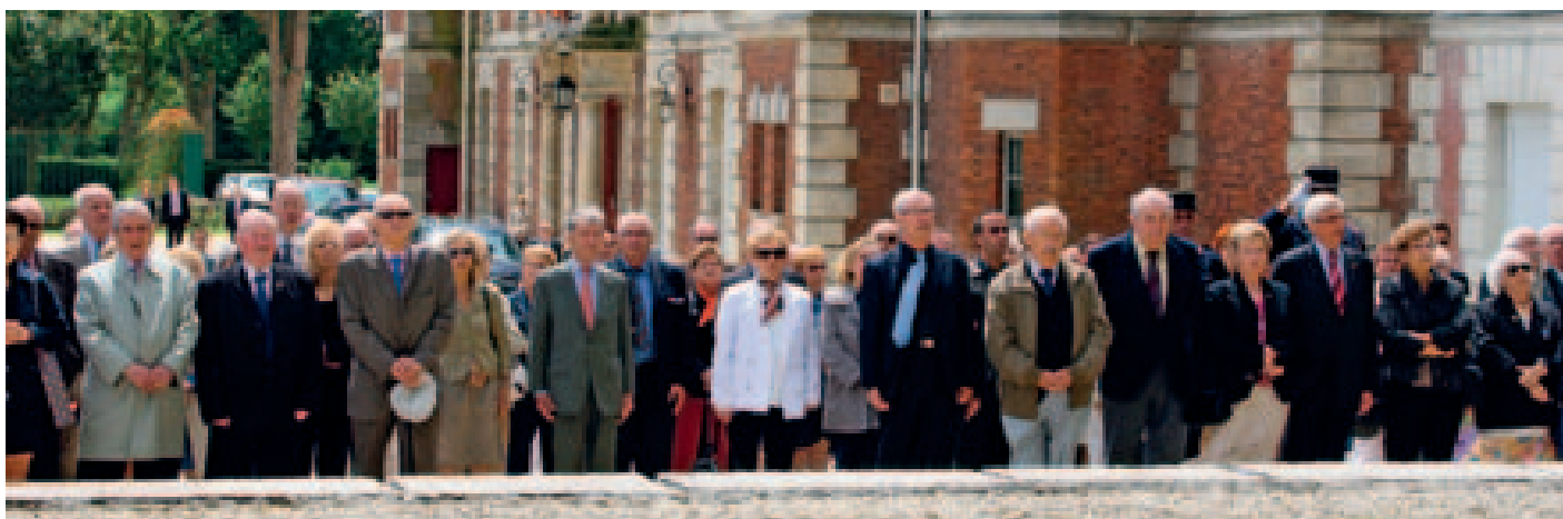
▲ Un moment de recueillement...